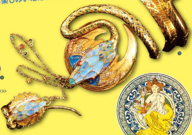
①(詩・四芸術) ●(絵画・四芸術) ●(ダンス・四芸術) ●(音楽・四芸術) ※①-④すべて1898年 リトグラフ、紙 ●(ラ・ナチュール) 1899-1900年 ブロンズ、アメジスト ⑤(白い象の伝説) 1894年 書籍 ●(目を閉じた少女) 1920年頃 油彩、カンヴァス ●(珠を持つ女) 1898年 鉛筆、紙 ⑥(ビスケット缶) ルフェール=ユティル 1899年、金風印刷 ●(蛇のプレズレットと指輪) 1899年 金、エナメル、オパール、ダイヤモンド ⑦(パリの象徴: 絵画) 1897年 陶器 ※①-④まで全てアルフォンス・ミュシャ作、弊 アルフォンス・ミュシャ館(堺市)蔵