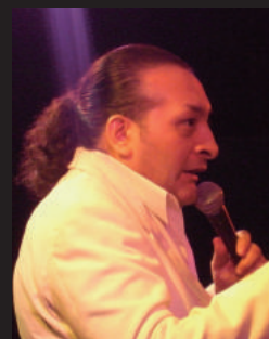
ゲストボーカル ロベルト・デ・ロサーノ