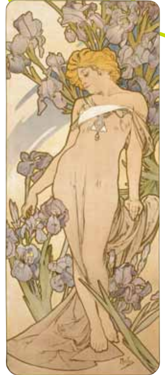
アイリス:四つの花 1897年 リトグラフ、紙

*上記全てアルフォンス・ミュシャ作、堺 アルフォンス・ミュシャ館(大阪府堺市)蔵