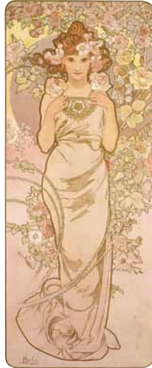
バラ:四つの花 1897年 リトグラフ、紙