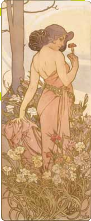
カーネーション:四つの花 1897年 リトグラフ、紙

フランスの19世紀末を彩ったアル・ヌーヴォーを代表する芸術家アルフォンス・ミュシャ(1860-1939)は大女優サラ・ベルナルに見いだされたことをきっかけに一躍人気のデザイナーとして才能を豊かに開花させていきました。没後80年に開催される本特別展では、ミュシャがパリで制作した代表的な装飾パネルを中心に、同時代に活動したルネ・ラリック(1860-1945)のジュエリーやガラス工芸と共に約130点をご紹介します。本展ではミュシャが描く代表的な装飾パネルをはじめ、ラリックが手掛けたジュエリーや工芸品をとらえて見られる世紀末に彩られた花や植物にスポットをあてます。さらに、公益社団法人 日本フラワーデザイナー協会(NFD)のご協力のもと、作品とコラボレートしたアーティフィシャルフラワーによるフラワーアレンジメントもお楽しみください。