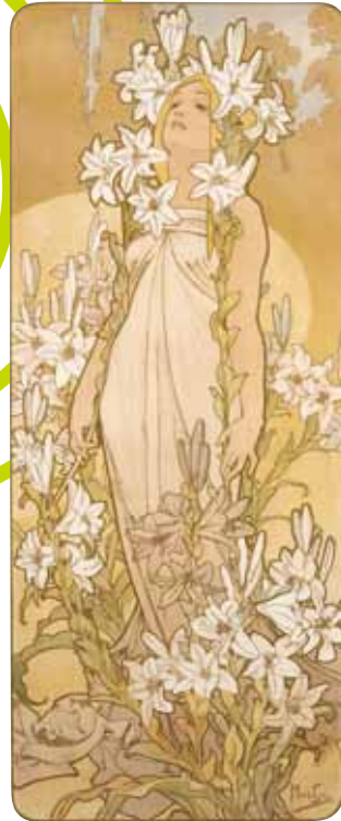
ユリ:四つの花 1897年 リトグラフ、紙