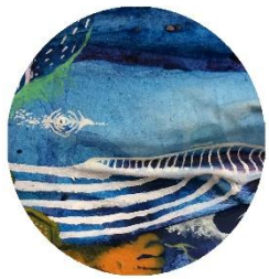
【クジラさん】 ロの先にフジツボが ついているけど おらかなので 気にしない