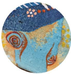
【おおきな おたまじゃくし】 ちいさいカエルの 子供のころ