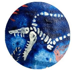
【深海魚(骨)】 動いているものに 反応してガブリ!