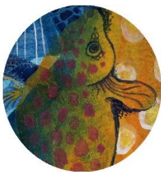
【赤いうろこの魚】 少し透ける深海魚