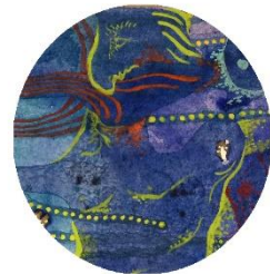
【ケンタウロスさん】 暴れん坊で 不完全