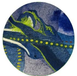
ワニのような ヘビのような トリのような マヌケそうな