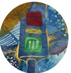
【信号機】 青い世界なので 進めは緑色