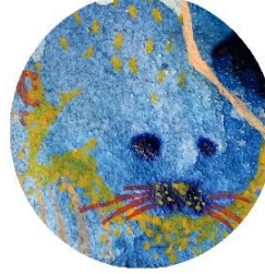
【赤ひげアザラシ】 抱きしめたら フワフワしている のだろうか…