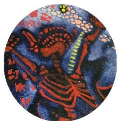
遺跡で叫ぶ 怪しいガイコツ