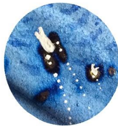
【プランクトン】 水中でゆられて 生きるものたち