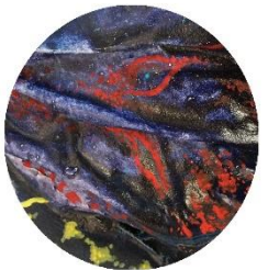
【海底遺跡の ドラゴンくん】 怖い!そして立体的