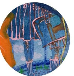
【深海の女子高生】 青春は海の底でも 始まっている