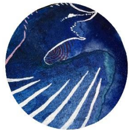
【青い鳥】 水中を飛び