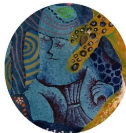
【ボーダー ターバンの娘】 水の流れに 耳をかたむける