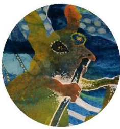
友達に会いに深海へ 街の賑わいに 目がチカチカ