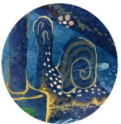
【カイトイマイマイ】 背すじ?をピンと しているところが 特徴的