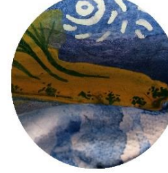
【キイロウミウシ小】 隙間に隠れている