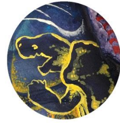
【海のカメ】 海にいるわりに リクガメのような手足