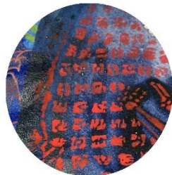
【文字石板】 何が書かれて いるのか 分からないけど ロマンがある