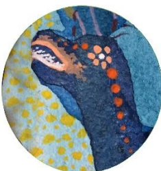
ここらへんで 一番長細くて 一番のオシャレさん