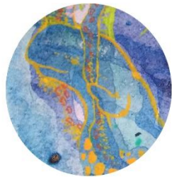
【マナティ】 タコの足を プランコにして ゆらゆらり