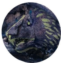
陰に隔れた 海のライオン