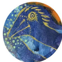
【クロール鳥】 いろいろかきわけ 進むトリ スポーツマン