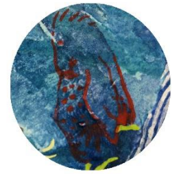
【タカさん】 変な生き物を 目の前にして しょんぼり