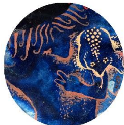
【ムササビと教授】 あっちは2つで… キミはどう思う? ムササビくん