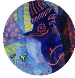
友達をはるばる 会いにきてくれて 嬉しくて 呪文を唱えちゃう