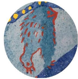
足あとつけて歩く かわいい生き物