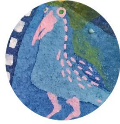
おそろく何も 考えていない鳥 今日も平和です