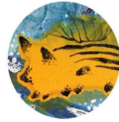
【キイロウミウシ】 しっぽ?が長い 癒し系