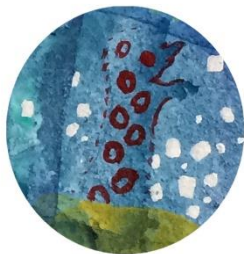
【チンアナゴさん】 長い植物を眺めて 親近感を感じている