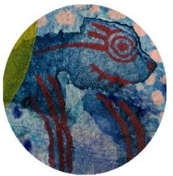
【テナガメガネ キツネウミザル】 手が長くて メガネをしている 狐のような 海のサル