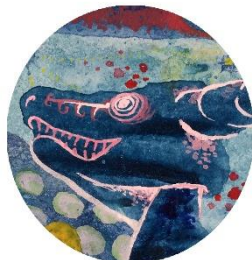
【ドラゴンヘッド】 いきいきしていて しかもご機嫌