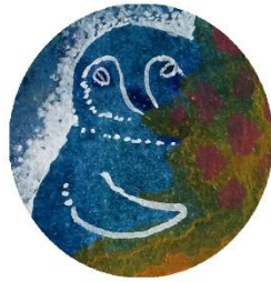
【ジェンスリー ペンギン】 少し照れ屋さん