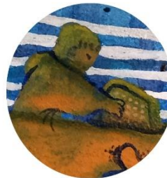
【水中バスの運転手】 真剣にパット操作