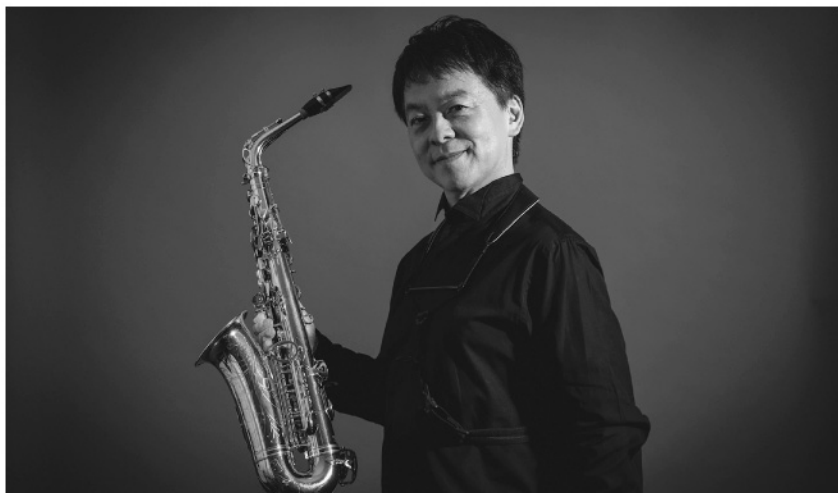
須川展也 (サクソフォン) Nobuya Sugawa, Saxophone

日本が世界に誇るクラシカル・サクソフォン奏者。ハイレベルな演奏と唯一無二のレパートリーが熱狂的な支持を集めている。国内外のオケと多数共演し、世界的な評価を得ている。07-20年までヤマハ吹奏楽団の常任指揮者を務める。トルヴェール・クワルテットのメンバー、東京藝術大学招聘教授、京都市立芸術大学客員教授。