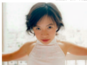
vol.1 北村成美 写真・中野史

申込期間:6月5日(土) 各回:1,500円(当日受付にてお支払いください) ※各回定員25名 主催:フェニーチェ堺