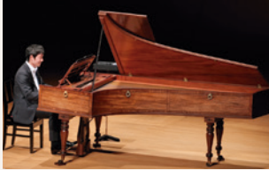
2020年12月25日フェニーチェ劇場公演の録音写真

書かれるということは世界的に見ても未だ頻繁にあることではなく、どのような作品が誕生するのか大変楽しみです。盛り沢山の今年度のリサイタルシリーズ、皆様のご来場心よりお待ちしております! *ピリオド楽器:フォルテピアノなどの古楽器の総称