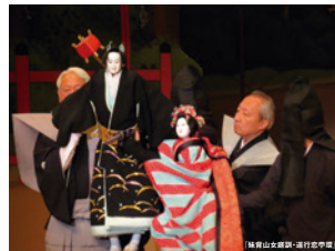
2021年3月19日フェニーチェ文楽公演の記録写真

文楽に魅入られ、劇場へたびたび足を運ぶようになって、観れば観るほどますます心をつかまれ、抜け出せなくなり……。ようするに、文楽【オタク】の道をまっしぐらに突き進んでいる私ですが、先日、そんな私にとって夢のような舞台に遭遇しました。フェニーチェ堺で催された「道行の美」。