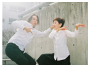
vol.4 セレノグラフィカ