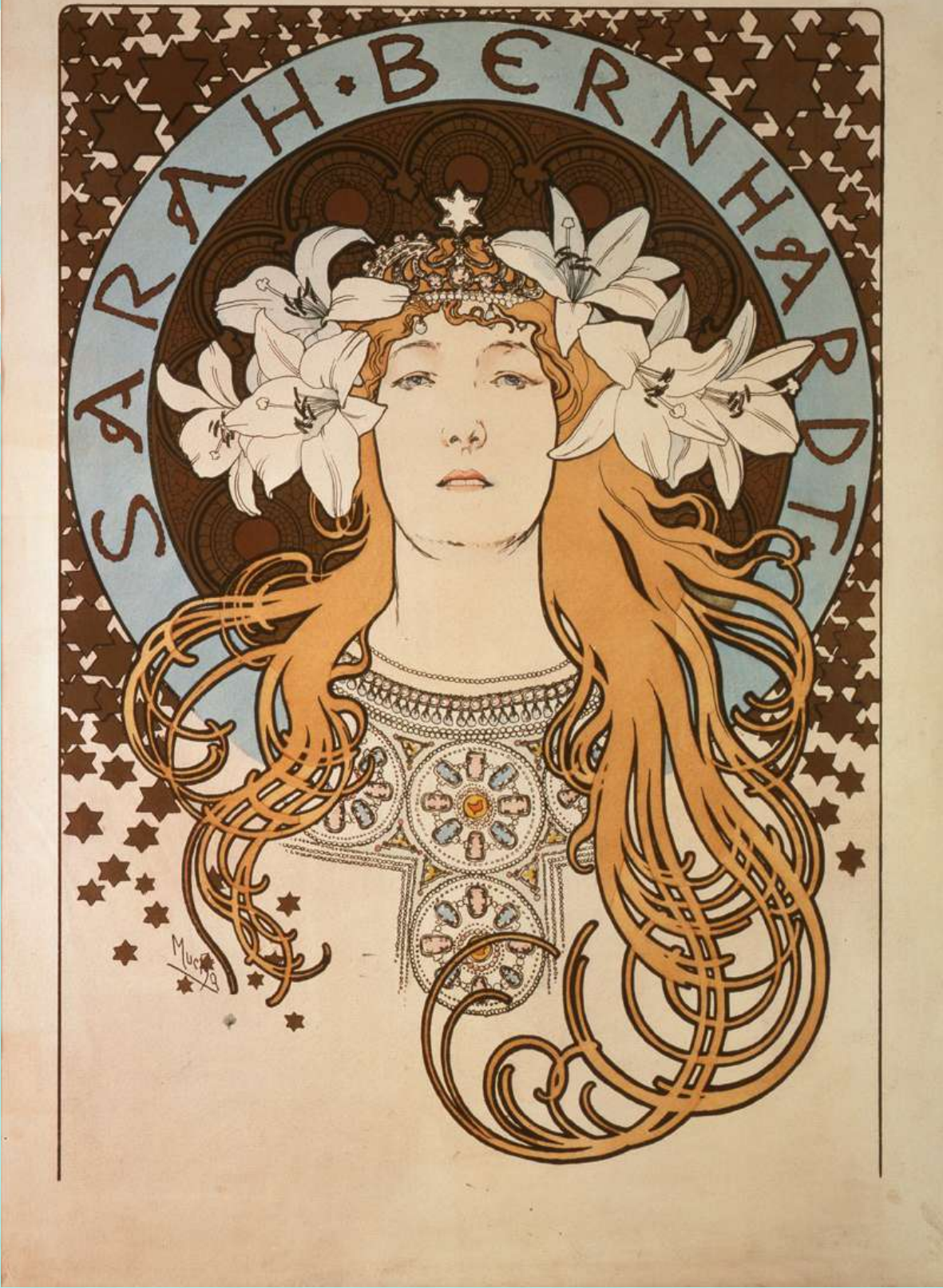
アルフォンス・ミュシャ 《サラ・ベルナール》 1896年 堺 アルフォンス・ミュシャ館蔵 (レプリカ)

アルフォンス・ミュシャはアールヌーヴォーの代表的画家で現在のチェコ共和国生まれ。パリの舞台女優、サラ・ベルナールのポスターを制作して一躍有名になります。ミュシャの作品はしなやかな曲線と美しい色彩が特徴。今回は4点で1セットの装飾パネル連作《四季》、《四つの宝石》、《一日の四つの時》そしてミュシャが初めて制作し、パリで一世を風靡したポスター《ジスモンダ》など25作品(レプリカ)を展示します。