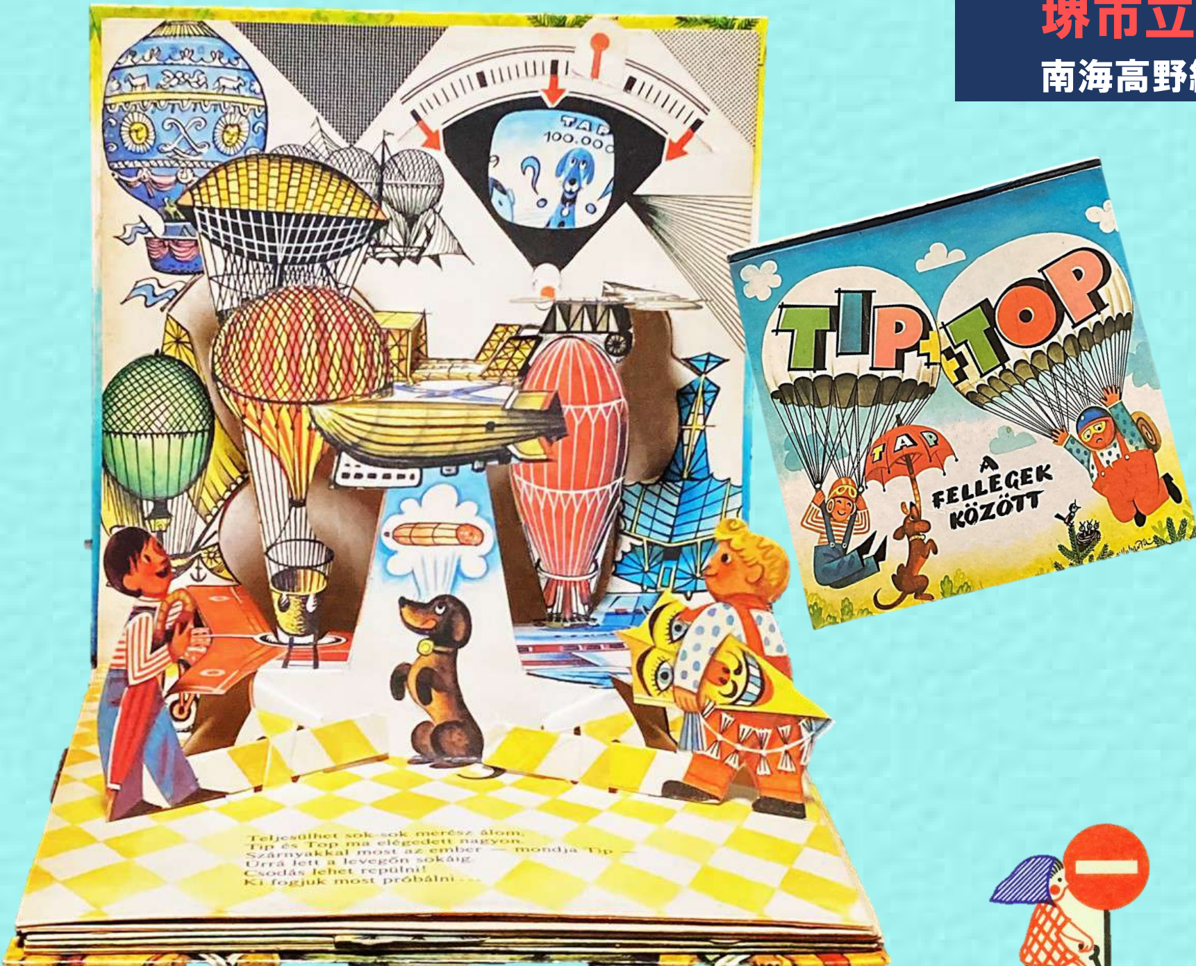
ヴォイチェフ・クバシュタ 《TIPとTOPシリーズ》 1986年 南 明弘 南 晃代 コレクション

アルフォンス・ミュシャの生まれ故郷チェコのかわいいアート。チェコの絵本作家、ヴォイチェフ・クバシュタとグスタフ・セダの仕掛け絵本をはじめヨゼフ・ラダ、チャペック兄弟の絵本、装丁本や1960年代から70年代につくられた魅力的なマッチラベル(約1000枚)などを展示します。