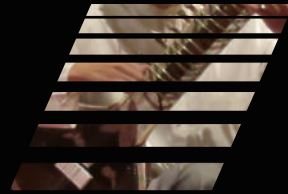
シタール奏者:野口昌彦 Sitar player: Masahiko NOGUCHI