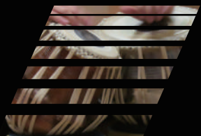
タブラ奏者:上坂朋也 Tabla player: Tomoya UESAKA

堺市立東文化会館は新型コロナウイルス感染拡大状況に応じた「感染拡大防止対策」を実施しております。