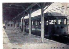
浜寺停車場絵葉書（明治頃）

戦前の海浜リゾートだった大濱の潮湯や水族館、浜寺の絵葉書や当時の商店広告などの資料も展示します。