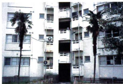
旧中百舌鳥団地スターハウス