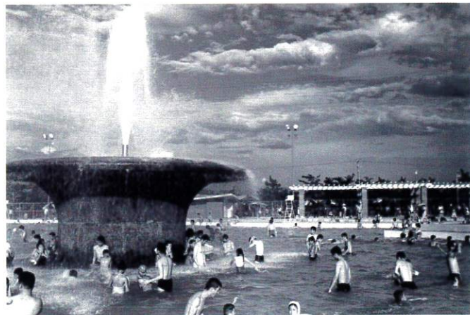
浜寺公園プール（昭和 38 年）

堺に何館も映画館があった「あの頃」 商店街が多くの人で賑わっていた「あの頃」 今日より明るい明日を信じられた「あの頃」 スマホやネットはなかったけれど 暖かいつながりがあった「あの頃」 閉塞感なんてなかった時代へのノスタルジー。 そんな時代の堺市の写真（堺市所蔵）約 50 点 を展示します。