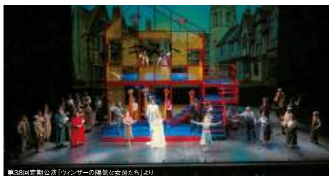
第38回定期公演「ウィンザーの陽気な女房たち」より

全席指定 SS¥15,000 S¥12,000 A¥10,000 B¥8,000 C¥5,000 堺シティオペラ第39回 定期公演 オペラ『フィガロの結婚』 全4幕 (原語上演・字幕付)