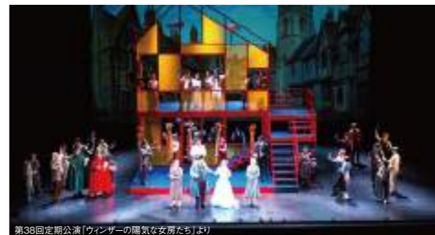
第38回定期公演「ウィンザーの陽気な女房たち」より

ヨーロッパが未だ貴族社会だった時代——伯爵家に仕える召使いのフィガロと婚約者のスザンナが、幸せを得るためにあらゆる階層の人々を巻き込んで繰り広げる、狂おしき一日! モーツァルトの軽やかな音楽と共にオペラの醍醐味をお楽しみください。