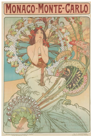
《モナコ・モンテ＝カルロ》1897年 リトグラフ、紙 Monaco・Monte-Carlo (1897), lithograph on paper