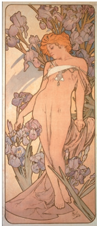
《アイリス：四つの花》1897年 リトグラフ、紙 Iris: The Flowers (1897), lithograph on paper