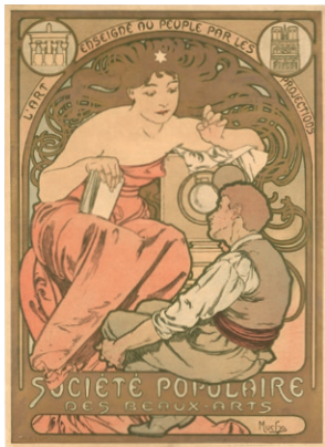
《民衆美術協会》1897年 リトグラフ、紙 Société Populaire des Beaux-Arts, 1897, lithograph on paper

世界に例を見ない体系的な約500点のミュシャコレクションの魅力をご紹介します。さらにさまざまなテーマでミュシャに光をあててきた展覧会づくりの裏側や、あまり光のあたらない保存修復や教育普及など、ミュシャ館の仕事の“舞台裏”をまるごと展示します。