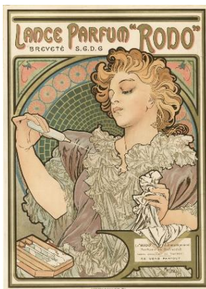
5、アルフォンス・ミュシャ 《ランスの香水「ロド」》