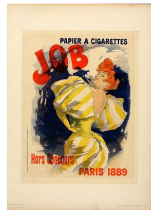
3、ジュール・シェレ 《タバコ巻紙「ジョブ」》 『ポスターの巨匠たち』より