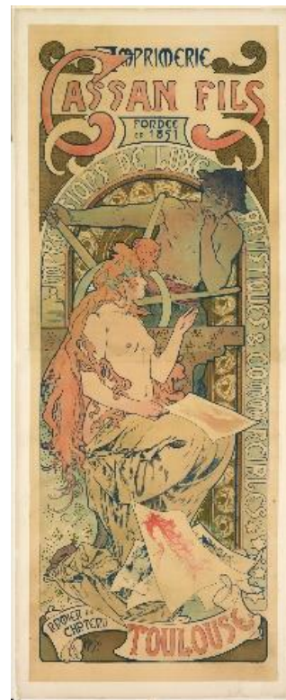
8、アルフォンス・ミュシャ 《カッサン・フィス印刷所》