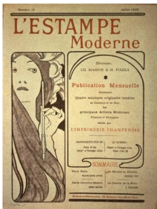
2、アルフォンス・ミュシャ 《『レスタンプ・モデルヌ』誌表紙(第15号)》