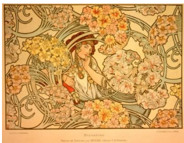
6、アルフォンス・ミュシャ 《ビザンティン：ミュシャの壁布プロジェクト》