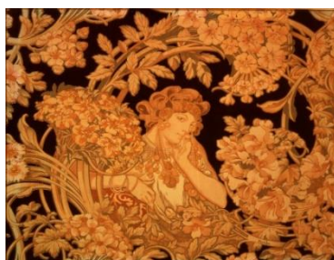
7、アルフォンス・ミュシャ 《ビザンティン：壁布》