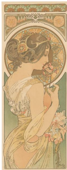
2、アルフォンス・ミュシャ 《桜草》