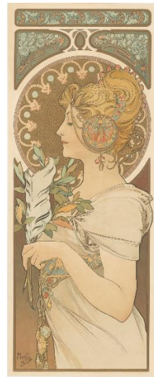
3、アルフォンス・ミュシャ 《羽根》