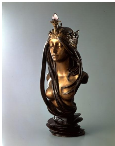
5、アルフォンス・ミュシャ 《ラ・ナチュール》