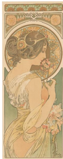
2、アルフォンス・ミュシャ 《桜草》