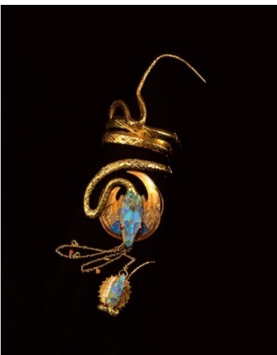
4、アルフォンス・ミュシャ 《蛇のブレスレットと指輪》