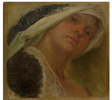
6、アルフォンス・ミュシャ 《チェコの少女の肖像》