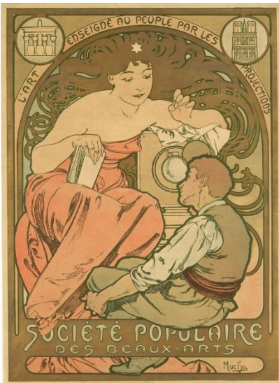
1、アルフォンス・ミュシャ 《民衆美術協会》