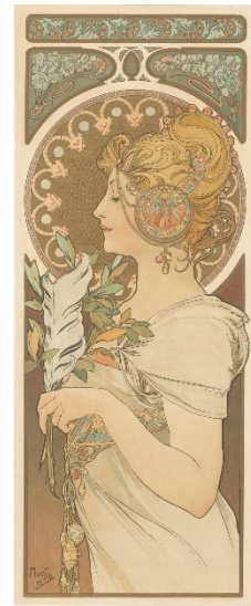
3、アルフォンス・ミュシャ 《羽根》